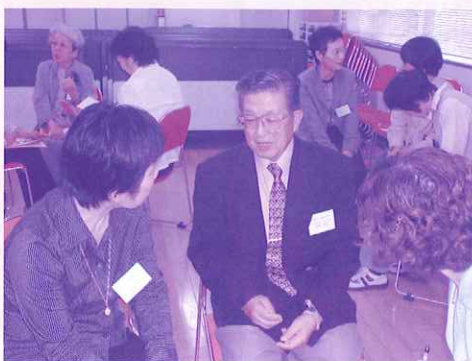
会員同士のスキルアップ学習の様子

『高齢者施設における傾聴活動』定例会。会員同士のスキルアップ学習。を活動の中心とし、現在是在宅における傾聴活動にも裾野を広げ、地域に暮らす高齢者の孤独感の解消・心の癒しのため活動を行なわれています。