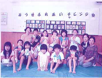
絵手紙を手に『ハイ・チーズ。』頑張って描きました。