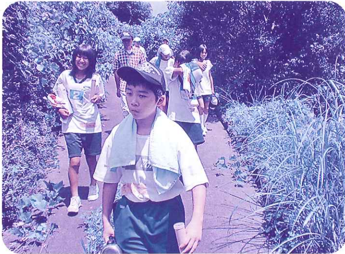
野外での環境学習