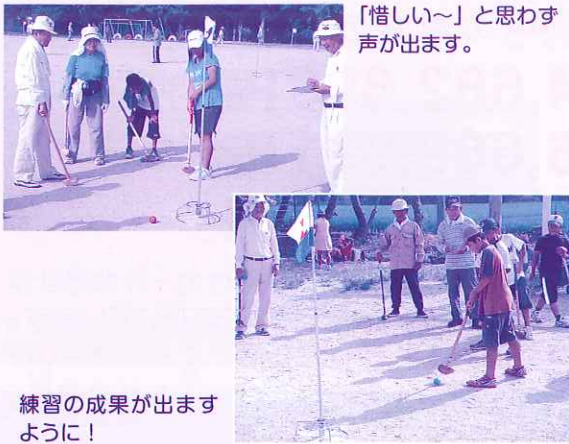
「惜しい～」と思わず声が出ます。

当日は、100名以上が参加。それぞれのチームで高齢者と子ども達が教わったり、いろいろと話したり、様々なふれあいが出来たようです。また、選手の皆さんは数日前からの練習の成果を発揮され、夏の暑さにも負けない熱戦が繰り広げられました。