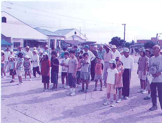
開会前の参加者たち、チームごとに整列!!