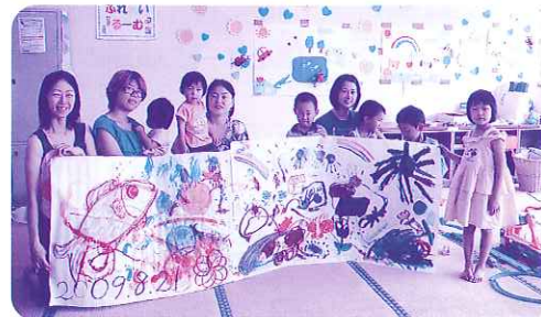
— 「みんなでアート! 壁画」— 毎週金曜日は、「くんくん金曜日」です。この日は模造紙いっぱいにお絵かきを楽しみました。

子どもをつれて、お友だちづくりのできる場所。普段の生活の場からしばらく離れて、子どもと向き合う場所。そんな場所ができました。