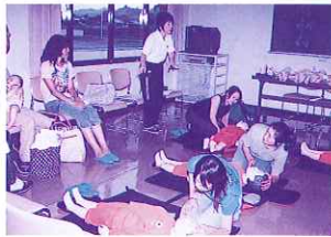
みんな真剣に学んでいます。