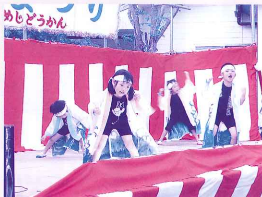
みんなで“ワッショイ！” 元気パワー全開。

内野太鼓演奏をはじめ、元気な子どもみこしや松梅小中学校の生徒たちによる出し物など松梅の空に元気な声が響きわたりました。