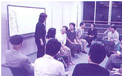
昨年の養成講座の様子