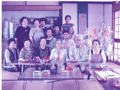
サロン徳間会の方々

社会福祉協議会では、皆さんの地域の色々な活動を応援しています。 「あなたの『やってみたい』はまちの力になる!!」を合言葉に、地域での活動を紹介していきます。