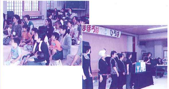
大型絵本のはじまり、はじまり～!