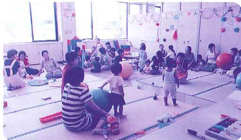
— 「ふれあいるーむ」オープン後のはじめてのサロン— 子育て家庭の世代が多様化する中、地域の生活課題を発見する場にもなります。

雨の日も、雪の日も、暑い日も、寒い日も、ふれあいるーむ♪ ゆとりのある日も、イライラする日も、ふれあいるーむ♪