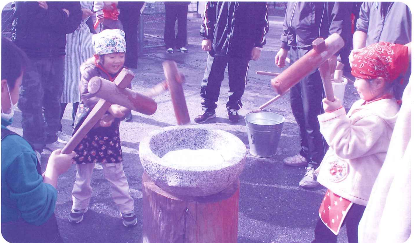
松梅児童館・松梅小中学校合同で「親子餅つき大会」が行われました。「べったんこ それ べったんこ」と楽しい掛け声を響かせ、つきたてのほっかほっかのお餅を口いっぱいにはおぼりました。(12/6 松梅小・中学校にて)