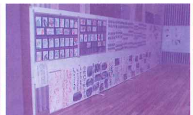
絵手紙や折り紙を受講された方の作品や子育て支援活動をパネルで展示しました。平成21年7月にオープンした「ふれあいの輪」の今を楽しく紹介しました。