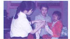
大きいハンカチで「ささっ」と処置！