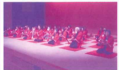
一輪車演舞の活力をもらい、意気揚々と奏でる銭太鼓愛好会の皆さん