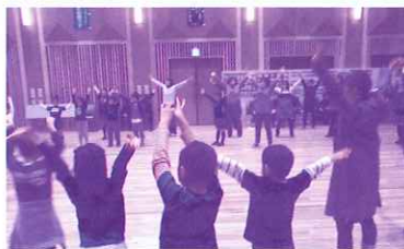
レクリエーションを通じて、みんなが繋がりました。

地域の子ども・親・高齢者・地域住民がレクリエーション、一輪車演舞や銭太鼓を通じて、地域の中で支えられていることや世代間のつながりの大切さを理解しあい、地域の教育力を高めることができました。