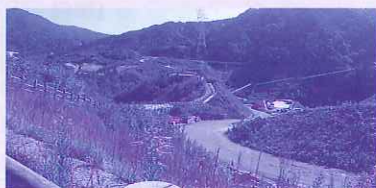
国道から見る嘉瀬川ダムの様子

日常生活からはなれ気分転換を図り、元氣な皆さんの笑顔が今日一日の楽しさを物語っていました。