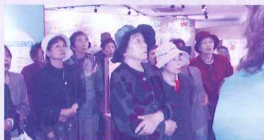
熱心な研修の様子