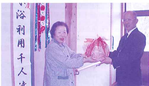
私と一緒に流水浴で元気になりましょう。