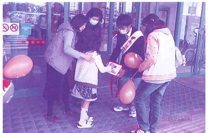
小さな手から大きな手まで多くの温かい心をいただきました。 (11/21 大和ジャスコにて)