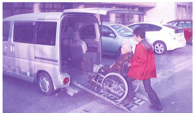
おひとりでは移動が困難な車イスご利用の方の外出を支援しています。

なお、世帯毎の募金は自治会長さんや班長さんに集めていただいています。ご協力に対し、この場を借りてお礼申し上げます。