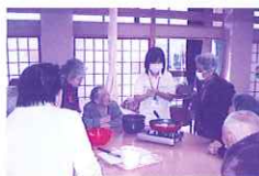
みんなで生花やおやつ作りを楽しんでいます