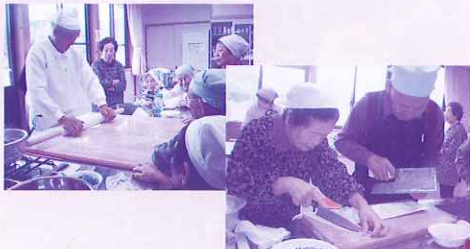
年はとつても腕前は玄人肌!!

三瀬支所では、年6回料理教室を実施しており、今回は参加者の得意料理を披露していただきました。昔懐かしの手打ちうどん作りでは、全身を使つてのうどん打ちに感嘆の声が上がりました。昔はこの家庭でもうどんを打って食べていたと会話が盛り上がりました。