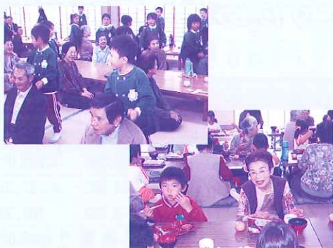
元氣ばもろ〜たよ。楽しかったあ〜!

参加された皆さんからは、「楽しみにしとっけん、またしてください、職員も喜びひとしおでした。協力いただいた皆様、ありがとうございました。」