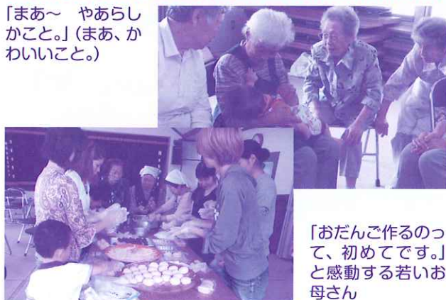
「おだんご作るのって、初めてです。」と感動する若いお母さん