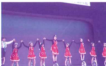
技を巧みに組み入れ、フロアーから大きな拍手をいただきました。