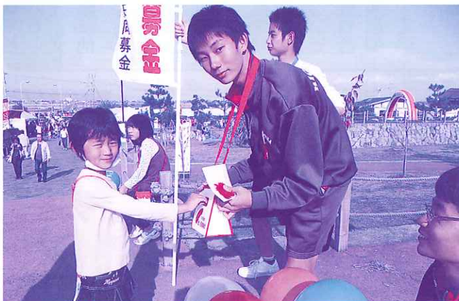
「シチメンソウまつり」のイベント募金活動 「みなさまからの温かいご支援「ありがとう」(11/7 干湯よか公園にて)