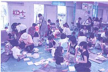
諸富家具組合の“木工コーナー” 未来の職人を目指して、子ども達が腕を磨いています。