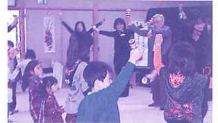
みんなで楽しく“Let's サンバ”オーレ!