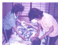
社協のヘルパーです。体調はどうですか?