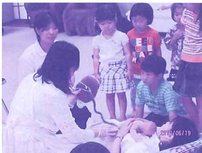
“胎盤”赤ちゃんとお母さんをつなぐ糸。