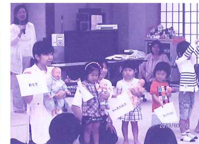
お腹の中で赤ちゃんはこんなふうには育ってるんですよ。