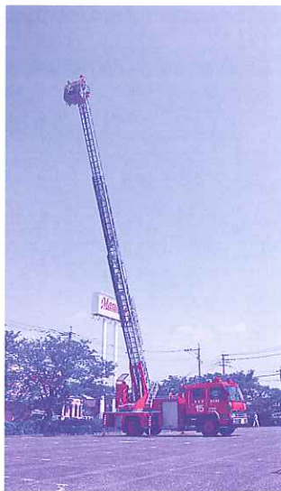
フェスタ初の“はしご車体験”