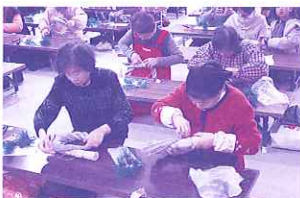
しめ縄づくりの様子

佐賀市社会福祉協議会の年末年始地域福祉交流事業助成金を受け実施した、しめ縄作りは、定員50名を大きくオーバー、お断りするほどの人気を博しました。参加者からは、「これでわが家もお正月を迎えられる」とたいへん喜んでもらいました。