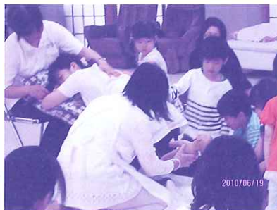
“おギャ〜”赤ちゃんが生まれたよ!!