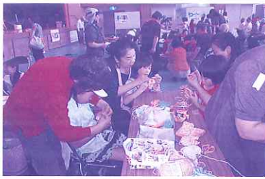
エコワシを作って、環境にも優しい子に育ってね。

地域の人の温かいまなざしの下、諸富南北小学生のボランティアも各コーナーで大活躍。とくにオーブニング(太鼓演奏)・フィナーレ(びらめき体操)では、子どもが主役となり、会場を大いに沸かせてくれました。大人から子どもまで地域の一人ひとりが主役になり、地域一丸となって取組んだ、とても温かいフェスタとなりました。