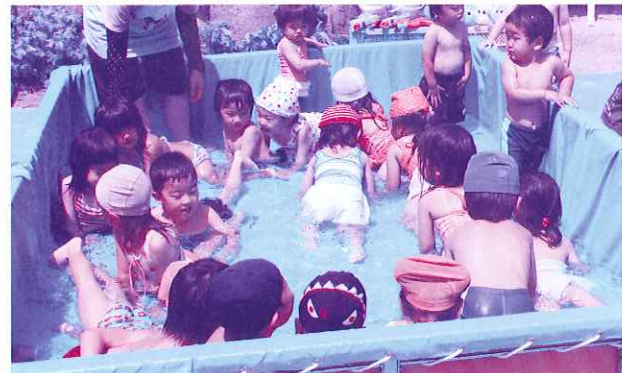
保育園:ベストフレンズ

なお、世帯毎の募金は自治会長さんや班長さんに集めていただいています。ご協力に対し、この場を借りてお礼申し上げます。