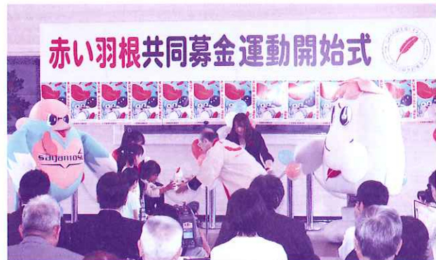
赤い羽根共同募金開始式(10月1日 佐賀県民ホール)