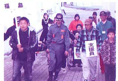
防災訓練風景 真剣なまなざしで訓練される久保田町住民の方々

去る11月26日(土) 佐賀市総合防災訓練が「高めよう地域の防災力」をテーマとして、佐賀市久保田町にて実施されました。災害時要援護者に対する安否確認や避難支援を迅速かつ確実に行うため、佐賀市防災訓練に合わせ、情報伝達訓練及び避難訓練並びに用具を使った支援方法の訓練を行い、災害に備えた支援体制の充実を図りました。当日は久保田町の方