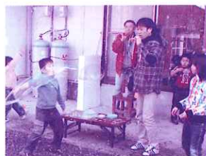
大人も本気で遊んだしゅぼん玉遊び

すべてが、公民館を中心に、蓮池校区各種団体の皆さんの協力により、蓮池なりの伝統の中に、一体感が確かに生き続けている、今日ではないかと確信しています。