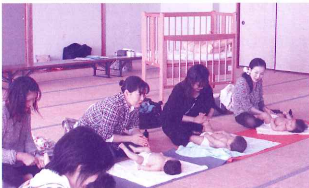
ベビーベッド等の育児支援設備を整備しました。