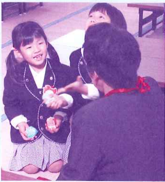
私の名前、覚えてくれた？