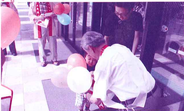
「温かい心を大切に！」みなさまの善意“ありがとうございます” (10月1日 モラージュ)