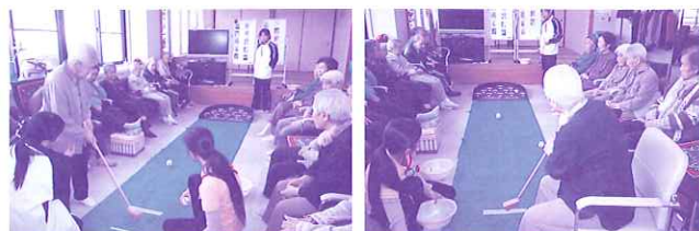
パットゴルフ風景

ご相談は無料です。お気軽にお問い合わせください。 「見学や一日体験」もできます。