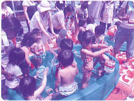
「ママたちも子どもたちと大はしゃぎ！」