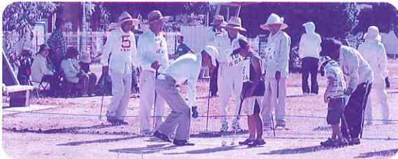
しめ縄作り・餅つき会