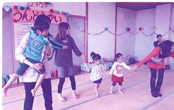
「楽し〜い運動会みんな頑張ったよ」