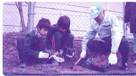
「きれいな花が咲くようにと願いながら 高齢者の方々と植え付け」