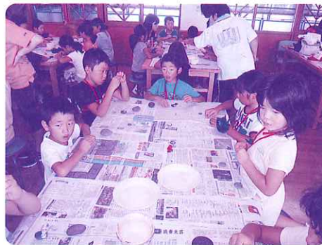
「ストーンアート作りに挑戦中」