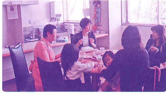
「3.11を機に佐賀へ来られた方々の居場所づくり」