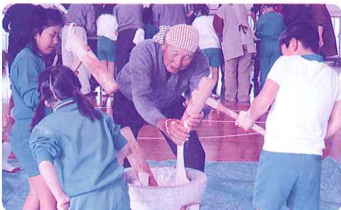
「できあがったしめ縄や餅はひとり暮らし 高齢者へ届けられました」