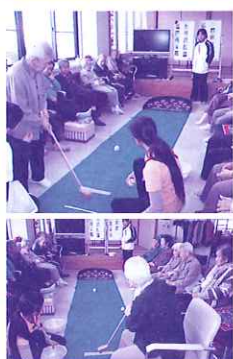
レクリエーション(パットゴルフ)