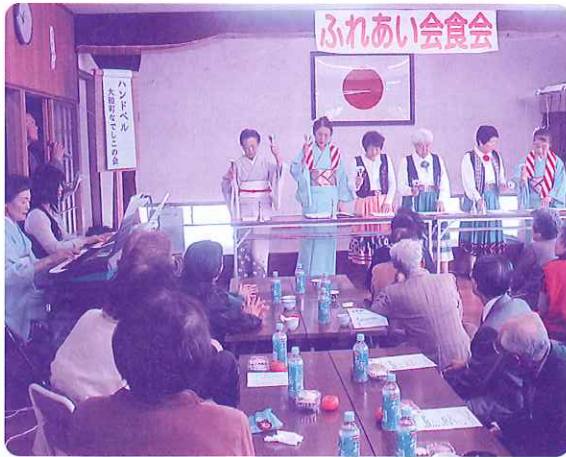
「会食後に大和町なでしこ会によるハンドベル演奏会」