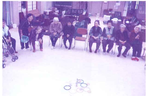
デイサービスさくら(レクリエーション)

●訪問介護事業：ケアプランに基づいて身体介護、家事援助、複合型のサービスを提供し、また身体障害者居宅介護支援事業として障がい者に対しても訪問介護のサービスを行いました。