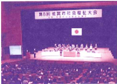
第8回 佐賀市社会福祉大会

◆ 地域子育て支援センター事業 親子でふれあうことのできる場の提供や子育てサークルによるサロンの開催、サポーターの育成など子どもが地域で健やかに育つことができるような事業を積極的に進めました。