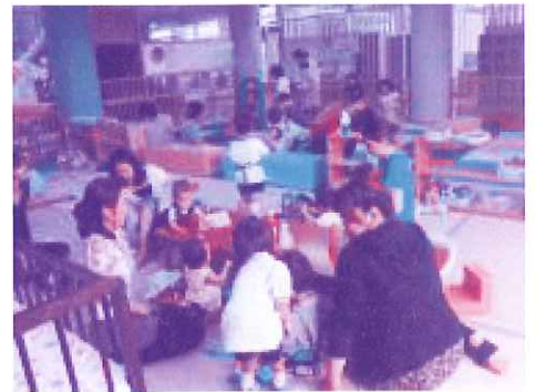
子育て広場の様子

● 児童遊園地・防犯灯整備助成：地域の自治会が管理を行っている児童遊園地の補修や、防犯灯(街灯)の補修・蛍光管等の取換えに要した費用の一部を助成しました。