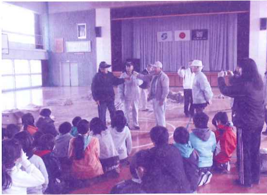
西与賀校区社協によるしめ縄づくり 西与賀小学校