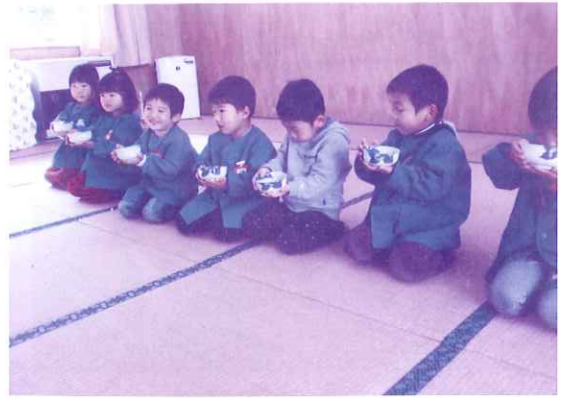
松梅児童館 (お茶教室)