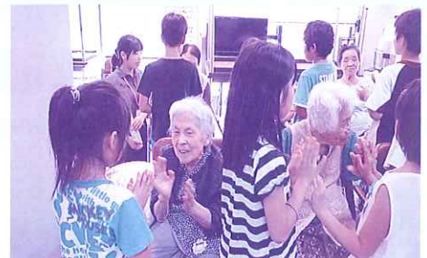
レクリエーションの様子