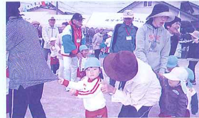
平松清風大学運動会参加