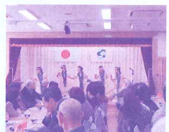
フラダンスに見入る!!