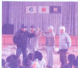
作り方を教える皆さん

出来上がったしめ縄は、民生委員・児童委員の皆さんと校区内のひとり暮らしのお年寄りの家庭を訪問し、手渡しします。その数150個。