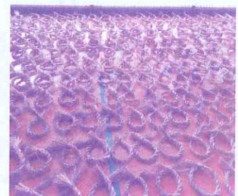
完成までもう少しのしめ縄!!