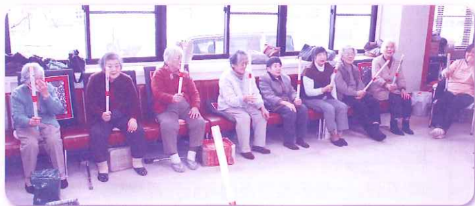
レクリエーションの様子