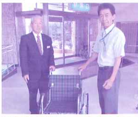
平安閣エヌビーオー互助会さま(左)