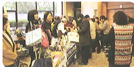
※障がい者作業所による販売もあります。

福祉意識の啓蒙と福祉関係者の意識高揚を目的に佐賀市社会福祉大会を開催します。多くの方のご参加をお待ちしています。