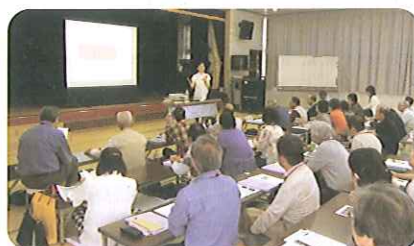
巨勢シルバーカレッジ