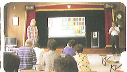
金立いこいの家文化講座