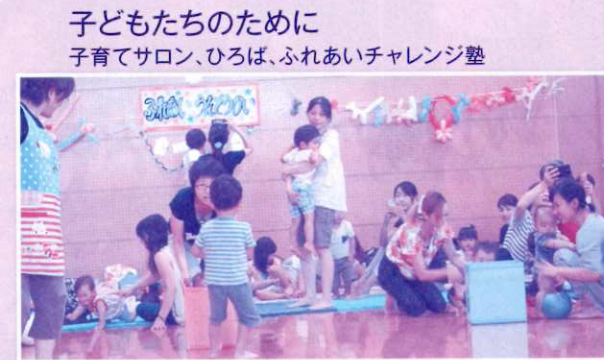
子どもたちのために 子育てサロン、ひろば、ふれあいチャレンジ塾