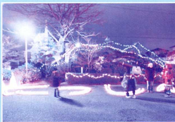
ライトアップで世代間交流

平成26年度にお寄せいただきました募金総額 32,183,740円 は次のような、地域福祉のために活用されます。