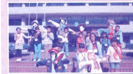
物作りの楽しさ大切さを体験する ふれあいチャレンジ塾