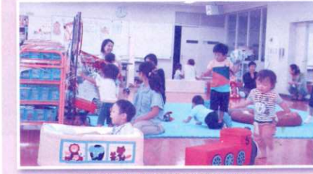
親子で気軽に過ごせるひろば