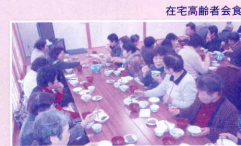
在宅高齢者会食会・ふれあい会食会