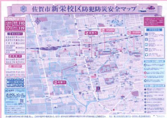
防犯・防災にむけた安全マップの作成