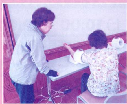
健康づくりと地域の絆づくり(血圧測定・ハンドベル)