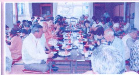
公民館に一堂に会して会食会