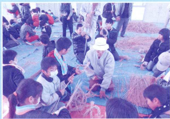
一人暮らしの高齢者へ届けるしめ縄作り