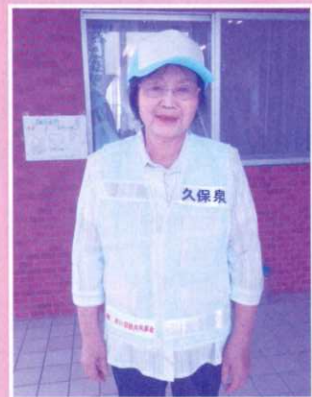
見守りやちょこボラ活動 活性化のためのピブス整備