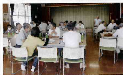
開成デイサービスセンター

これからは、隣近所や地域で暮らす一人ひとりへ、やさしい目配り・気配りをしながらお互いに、支え合いの活動を広げ、更なる安心して、楽しい暮らしができるように頑張りたいと思います。