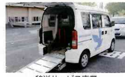
移送サービス事業

共同募金配分金事業 1907万7千円(3.4%) ●校区社会福祉協議会活動助成 ●在宅高齢者会食会助成 ●防犯灯設置助成 ●年末餅つき・しめ縄づくり ●福祉のまちづくり支援事業 ほか