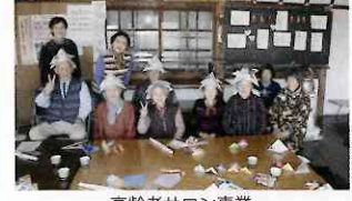
高齢者サロン事業