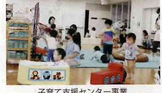
子育て支援センター事業