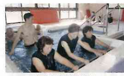
流水浴機器等管理

福祉サービス利用支援事業 2501万8千円(4.5%) ●福祉サービス利用援助事業 ●法人後見事業 ●移送サービス事業 ●松梅児童クラブ事業 ●富士町コミュニティバス運行事業 ●流水浴機器管理事業 ●福祉センター等会館管理事業 ●佐賀市産業振興会館管理 ●東与賀保健福祉センター管理 ●久保田総合センター管理