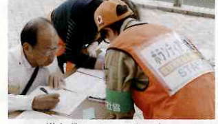
災害ボランティアセンター