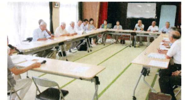
金立いこいの家にて