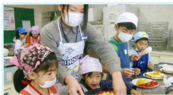
ふれあいチャレンジ塾