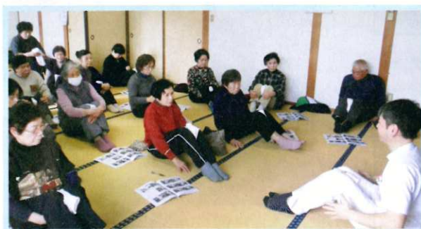
地域高齢者生活支援

昨年お寄せいただいた募金は今年度次のような事業へ主に配分されます(佐賀市分のみ掲載)