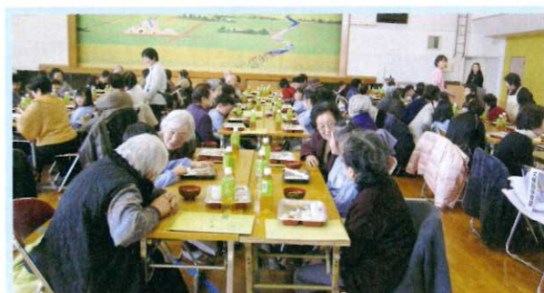
高齢者世帯会食交流会