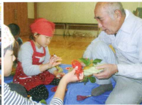
しめ縄づくり交流