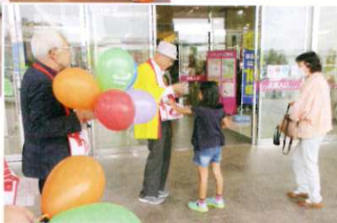
昨年の街頭募金のようす ▶

共同募金は、地域の様々な福祉活動 や福祉施設の支援など、幅広く活用 させていただく募金です。