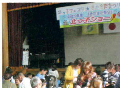
ふれあい祭り助成