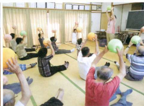
地域高齢者生活支援事業