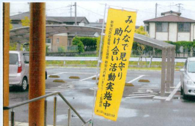
安心・安全なまちづくり支援事業(新栄校区)