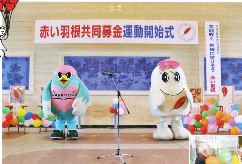
▲「サガン鳥栖」さまには、コラボ企画などでご協力 いただいております。