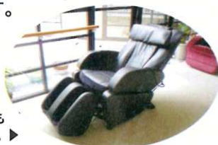
マッサージチェアも自由に利用できます。▶