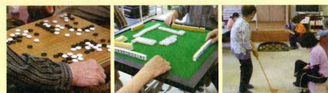
▲熱戦の囲碁対局 ▲健康麻雀で脳トレ ▲楽しく運動