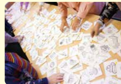
▲マッチングゲーム