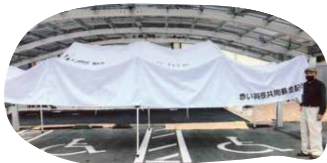
福祉のまちづくり支援事業

秋に行っている早津江祭りでテントを使用します。防災訓練の一環として、防災グッズの展示、販売をし、また、災害が起きた際、非常時炊き出し等に活用します。