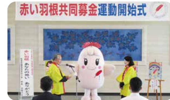
▲令和2年 赤い羽根共同募金運動開始式の様子

今年も多くの応募があり、佐賀県共同募金会において審査会が開かれ、部門別に優秀賞・最優秀賞が決められました。ご応募いただいた皆様、ご協力ありがとうございました。入賞された皆さん、おめでとうございます。