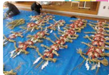
北川副校区・しめ縄作り