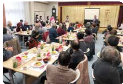
兵庫校区 在宅高齢者会食会（令和元年実施）

共同募金配分金をもとに、佐賀市社会福祉協議会が実施している事業の一部を紹介します。