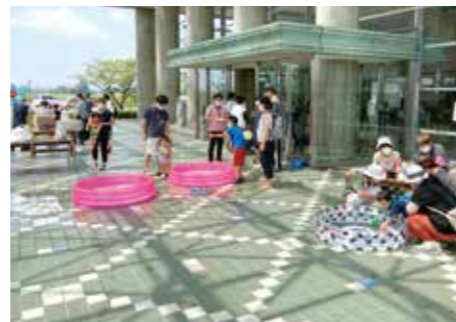
水遊び布で作った魚釣り