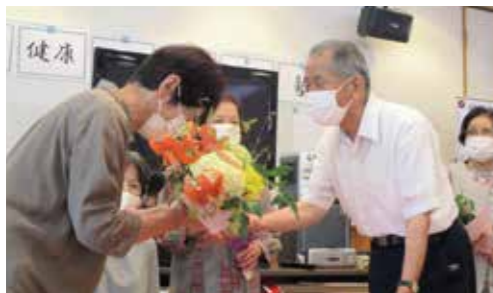
徳川令和健康道場百歳塾