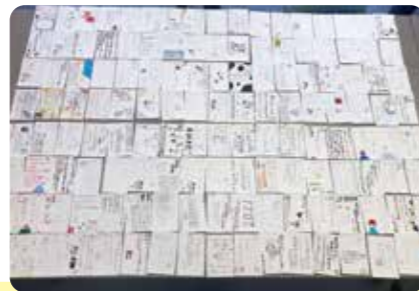
鍋島校区 年賀状ハガキ