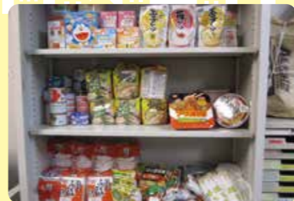
生活困窮者食糧支援