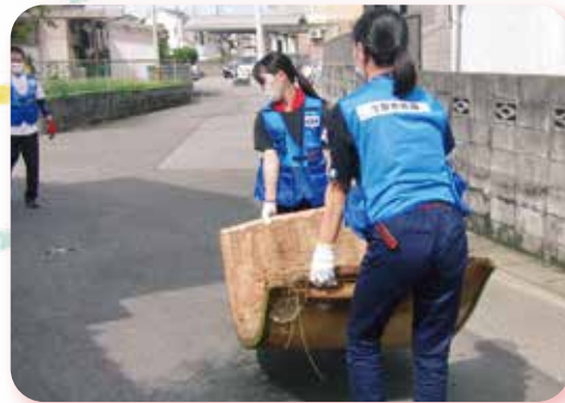
▲令和3年8月 大雨災害(佐賀県)災害ボランティアセンター活動の様子