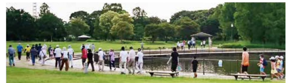
ラジ&ウォーク風景