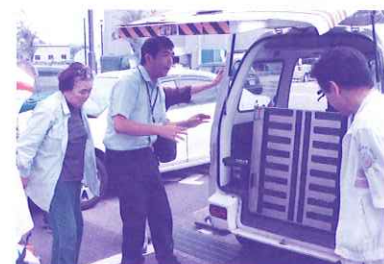
運転ボランティア養成講座の様子 (8/21・22)