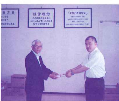
スーパーモリナガ社長より募金

集まりました義援金は、佐賀県共同募金会及び日本赤十字社佐賀県支部を通じて新潟県災害対策本部に送金。義援金配分委員会の決定を経て、被災者の方に届けられます。