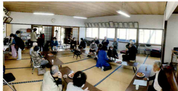
安住団地「おしゃべりカフェ」