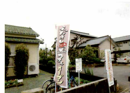
枝吉「えだよし ほっとカフェ」