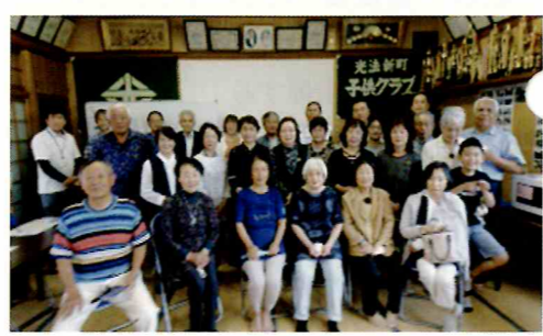
光法新町「かたらん会」