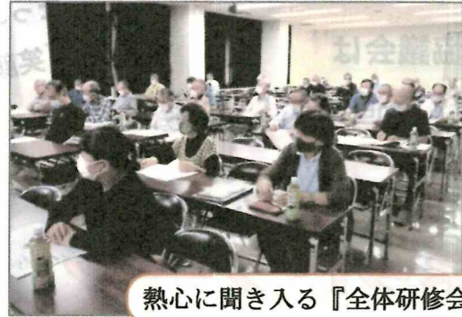
熱心に聞き入る『全体研修会』