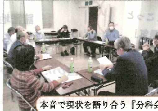
本音で現状を語り合う『分科会』