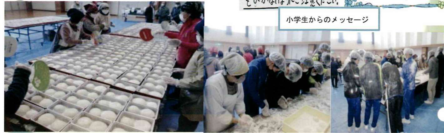
小学生からのメッセージ

こんにちはお元気ですか。 最近とても寒くなりましたね。 どうも、温かい服を着て、かぜ をひかないようにご注意ください。