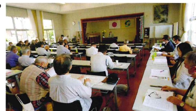
※令和4年度の校区社協の新役員は、下記のとおりです。