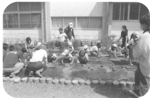
巨勢小学校中庭で、2年生48名といも苗植付けを行ないました。今年は大いもが収穫できたら・・・いいね～～～