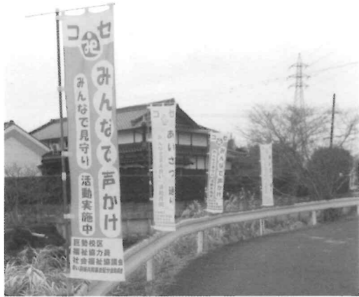
みんなで、あいさつ・声かけをしましょう 支え合い・助け合いの見守り月間。 16町区内には緑色、ピンク色の旗が掲揚されます。