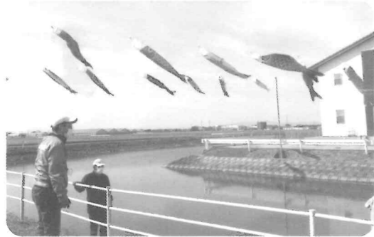
皆さん・・・見ていただけましたか？ 色あざやかに巨勢の鯉が泳いでいましたね