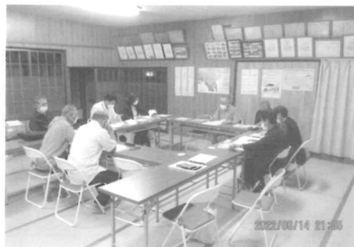
(高尾宿) 各町区10ヶ所の公民館で開催