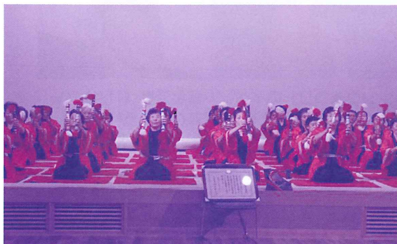
富士町銭太鼓愛好会の皆さん