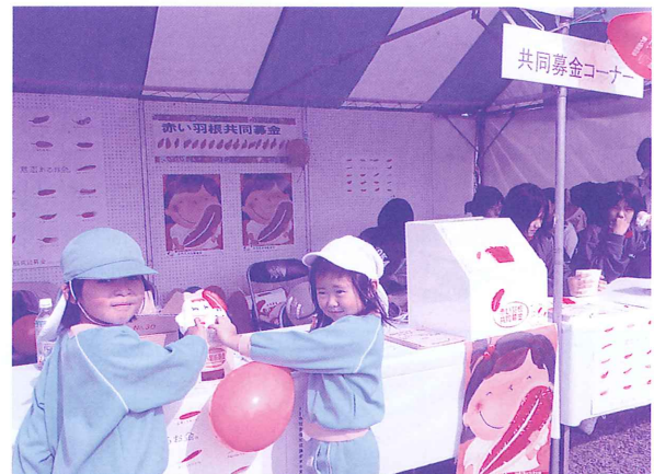
「シチメンソウまつり」のイベント募金活動(11/1) みなさまからの温かいご支援「ありがとう」