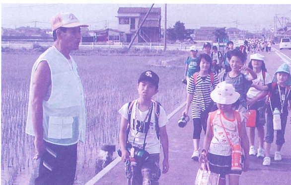
おはようございま～す。 今日も1日元気に頑張ろうねえ。

佐賀市社会福祉協議会 富士支所 「ふれあいチャレンジ塾」は、 体験の宝庫 子どもへのまなざし 100%の まちを目指しています！ ふれあいチャレンジ塾は、ボランティアネットワークの活動グループをはじめ、木工芸品グループや食生活改善推進協議会、老人クラブ、民生委員女性部など地域支援を受けながら土曜日を利用して年間24回実施しています。工夫を凝らし、学校では体験できないことに挑戦します。現在32名が登録しています。