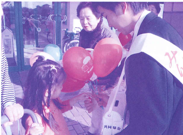
子どもたちも、笑顔で募金に参加してくれました。ありがとうございました。(11/22 大和ジャスコ店にて)