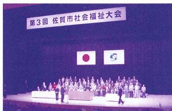
こんな雰囲気です。