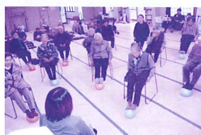
みなさん楽しく筋力アップ！