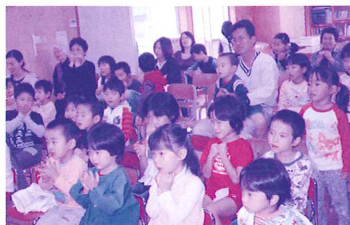
目を輝かせて楽しく過ごしました。 (10/25 松梅児童館)

次回日時 平成21年3月28日(出) 10時～11時 対象 幼児・児童とその保護者 内容 読み聞かせ 紙芝居・人形劇など 講師 おはなし会やまと 問合せ先 松梅児童館 ☎63-0344