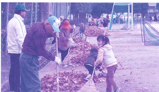
この日は諸富公園グラウンドの清掃と自治会館への花苗植栽を行いました(11/23)

社会福祉協議会では、皆さんの地域の色々な活動を応援しています。あなたの「やってみたい」はまちの力になる！を合言葉に、地域での活動を紹介していきます。