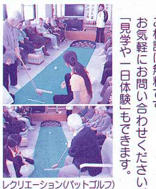
レクリエーション(パットゴルフ)

介護保険の認定を受けた方を対象に、送迎、入浴、食事、レクリエーション、所外活動等のサービスを提供し、心身機能の維持向上と家族の介護負担軽減を図っています。 ※利用するには 介護保険の認定が必要です。介護保険の申請については、当センターにご連絡いただければ、申請手続き等のお手伝いをします。 ※利用日時 月曜日から金曜日 午前9時30分～午後4時(送迎時間は含みません) 年末年始休みですが、祝日は開所しています。 ※利用料金 介護保険の適用相当分 (個人負担：1割) 昼食代(1食：400円) ※場所 佐賀市鍋島町森田27番地5 ※問い合わせ 開成デイサービスセンター (☎32-11730)