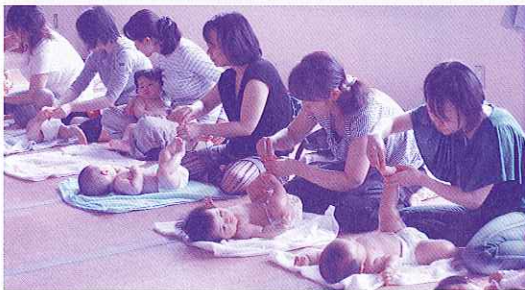
▲ベビーマッサージ