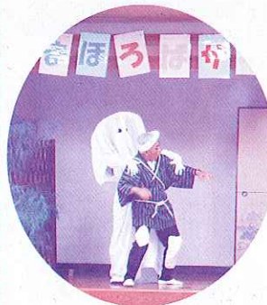
おぶさりてい(民話劇より)