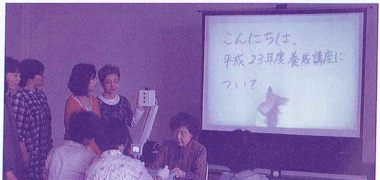
佐賀要約筆記サークル「虹の会」機器整備(スクリーン)事業

佐賀県共同募金会ホームページのダウンロードしてください URL: http://www.11.ocn.ne.jp/~sagahane/