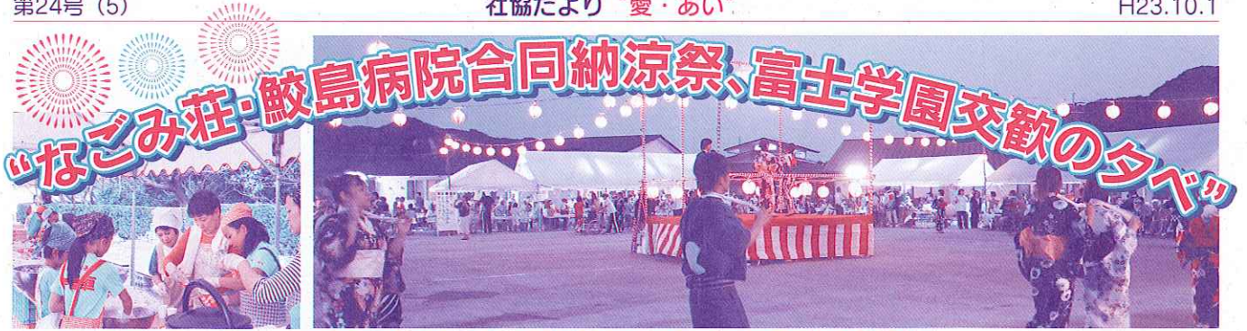
ボランティアさんの協力を得て、夜店が開店されました。