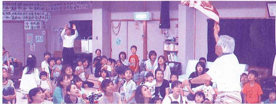
あれれ?? ボールが消えたぞ! (マジック)

【注意事項】 相談に対して適切な助言をすることが目的ですので、相手との交渉、手続き代行、相手を呼び出して仲介などを行うことはできません。