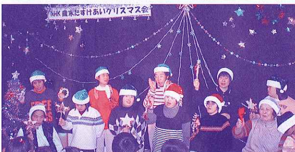
▲施設と地域とのふれあい活動(クリスマス会)