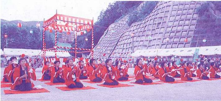
富士学園交歓の夕べ 銭太鼓愛好会の皆様により、銭太鼓の音色が鳴り響きました。

なごみ荘・鮫島病院では、地域の方々への感謝のひと時として納涼祭が、富士学園では「交歓の夕べ」として社会福祉協議会との共催で開催しました。特に「交歓の夕べ」は、昭和57年から富士学園と共催で開催されており、地域の皆さんとの共同の祭典として定着しつつあります。どちらの施設も地域の方による様々な出しものや夜店があり、銭太鼓の皆さんも日頃の成果を披露することができました。また、民生委員、児童委員や富士つ子一輪車クラブの親子も夜店に入り、フライドポテトやジュースを振る舞うなど地域の皆さんの支援を受けながら、楽しいひと時を過ごすことができました。