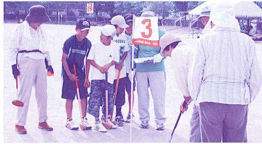
▲地域交流グランドゴルフ大会