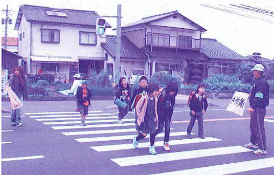
上恒安安全サポート隊の活動風景

防犯対策は自立つてこそ効果があるため、自立つ防犯グッズを用いての活動のほか、幟旗を多数たてて活発な防犯活動を展開中であることを広くアピールしています。予算面で苦勞しておりますが、共同募金の配分を受けることができて大変助かっております。本当にありがとうございました。