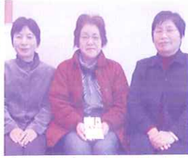
三瀬校区婦人会とJAさが三瀬支所の方々