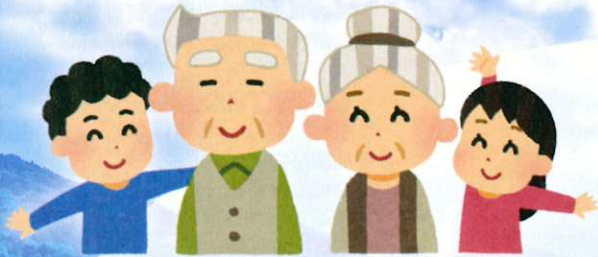
▼北川副校区 南佐賀団地