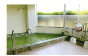
老人福祉センターお風呂