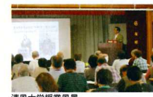
清風大学授業風景