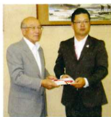
九州電力(株)佐賀支社さま(右)

〔本所〕 木下株式会社佐賀支店 九州電力株 佐賀支社ビル えききたマチ明かり フェスタ実行委員会