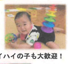
ハイハイの子も大歓迎！

広場に行きたくても遠くて行けない… 広場に行くのはちょっと緊張する… いつもと違った雰囲気楽しんでみたい！ そんな親子大歓迎♡ 時間内だったら出入り自由なので 気軽にあそびに来てくださいね☀