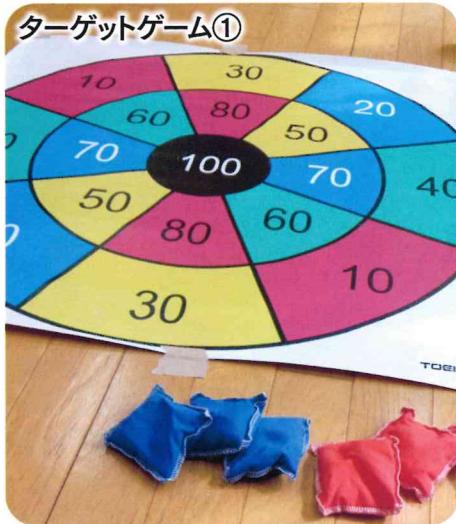
ターゲットゲーム①