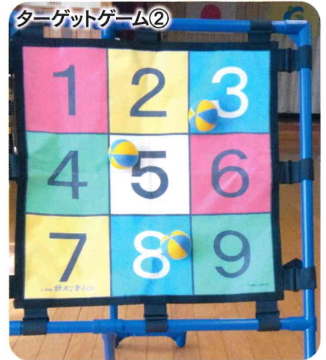
ターゲットゲーム②