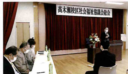
(ご来賓の御厨市社協会長)