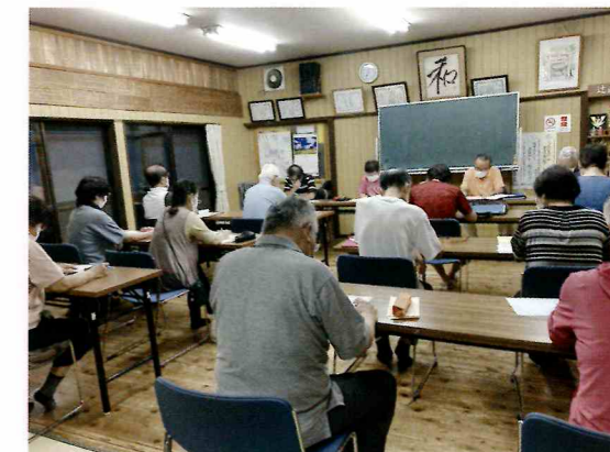
福祉協力員連絡会議：辻自治会

坪の上(10名)、辻(15名)、寄人(23名) 東高木(62名)、下高木(21名)、上高木(43名) 城北県営(3名)、川原屋敷(14名)、平尾(7名)