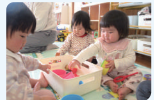
地域子育て支援センター事業 南部