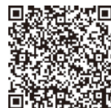
赤い羽根共同募金データベース 「はねっと」佐賀市概況

江越蒲鉾店 ニチイケアセンター久保田 サノ歯科クリニック 森永建設株 古賀石材店 下川商店 菊正寿司 のだ整形外科クリニック よしだ歯科クリニック 株エイト薬局 久保田店 医療法人メディスマイル いのうえ内科泌尿器科クリニック 有丸中 株ウチダ生コン部 久保田工場