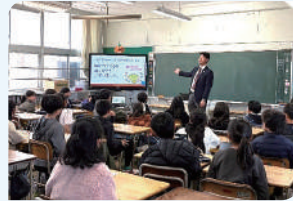
ふくし共育「とも学び」プロジェクト事業