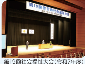
第19回社会福祉大会(令和7年度)