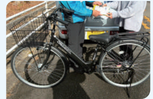
新入生応援プロジェクト