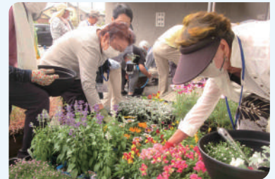
平松老人福祉センター