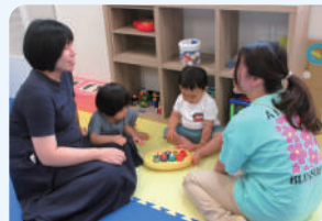
地域子育て支援センター事業 北部